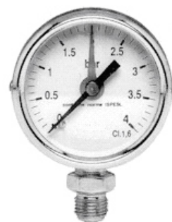
Art. 004.0543 vapore

A richiesta: esecuzione completamente in inox - flangetta per incasso a quadro - scale inferiori a 1 bar o superiori a 160 bar - con contatti elettrici.