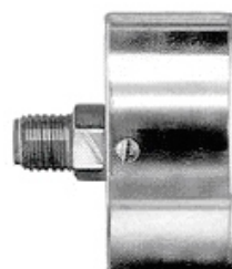
Art. 004.0549 vapore