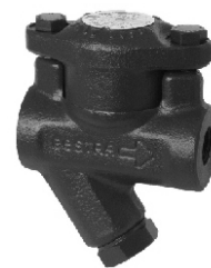
Art. 020.3512 Filettato

Archiata: attacchi ANSI - NPT - a saldare di tasca o di testa.