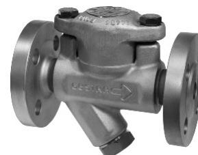
Art. 020.3512 Flangiato