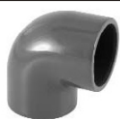
Art. 027.1090 Gomito 90°

Pressione massima 16 bar - Temperatura massima 60°C non contestuali