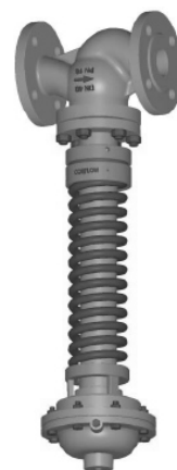
Art. 150.1315 Art. 150.1380 Art. 150.1360